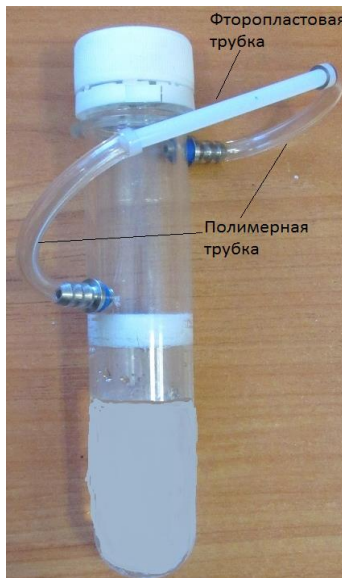
Рис.1 Картридж проверки