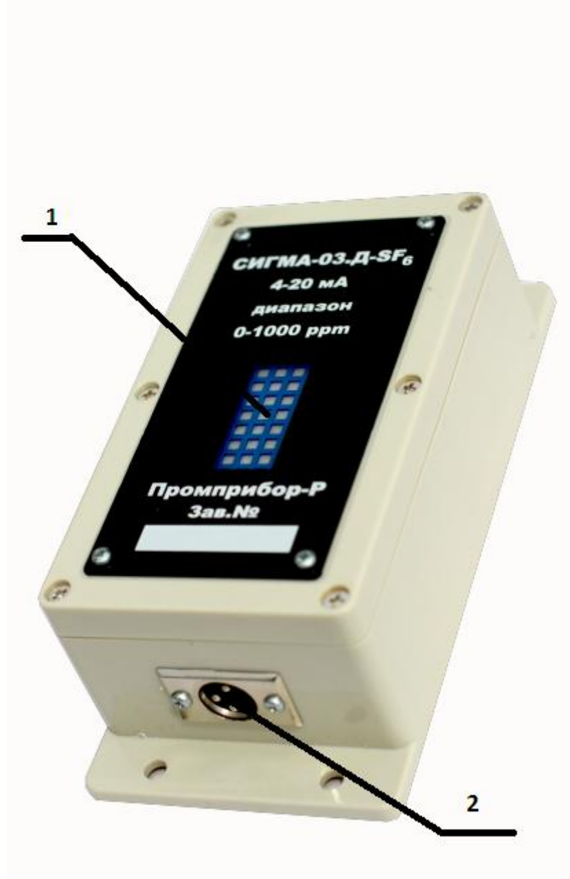
Рис.1. Внешний вид датчика СИГМА-03.Д-SF6.